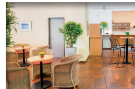
Lobby mit Coffee Bar

Im Mietpreis inklusive ist die Standardtechnik Flipchart, Pinnwand, bis zu 3 Mikrofone bei Veranstaltungen im Saal. Beamer und weitere Technik auf Anfrage gegen Aufpreis möglich.