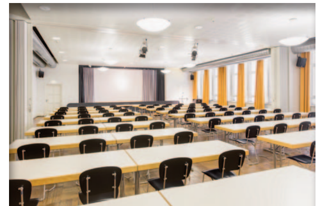
Unser größter Tagungsraum: Saal „Paris“

*** Drei Sterne im Herzen von Düsseldorf